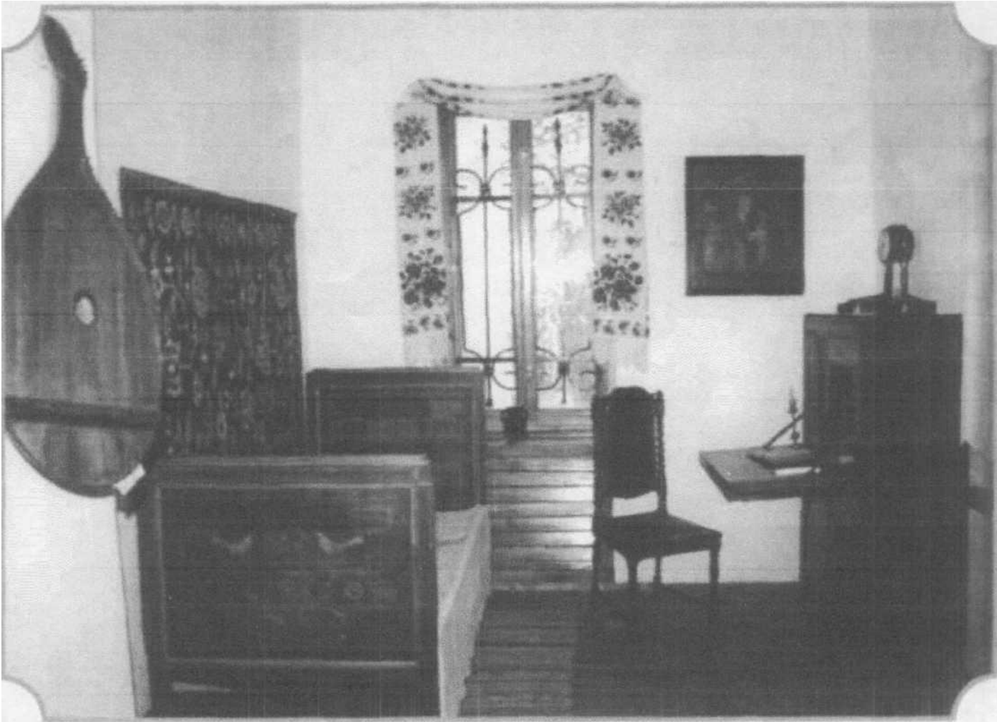
Кімната-опочивальня Г. С. Сковороди, відтворена в Літературно-меморіальному музеї просвітителя у селі Сковородинівці.