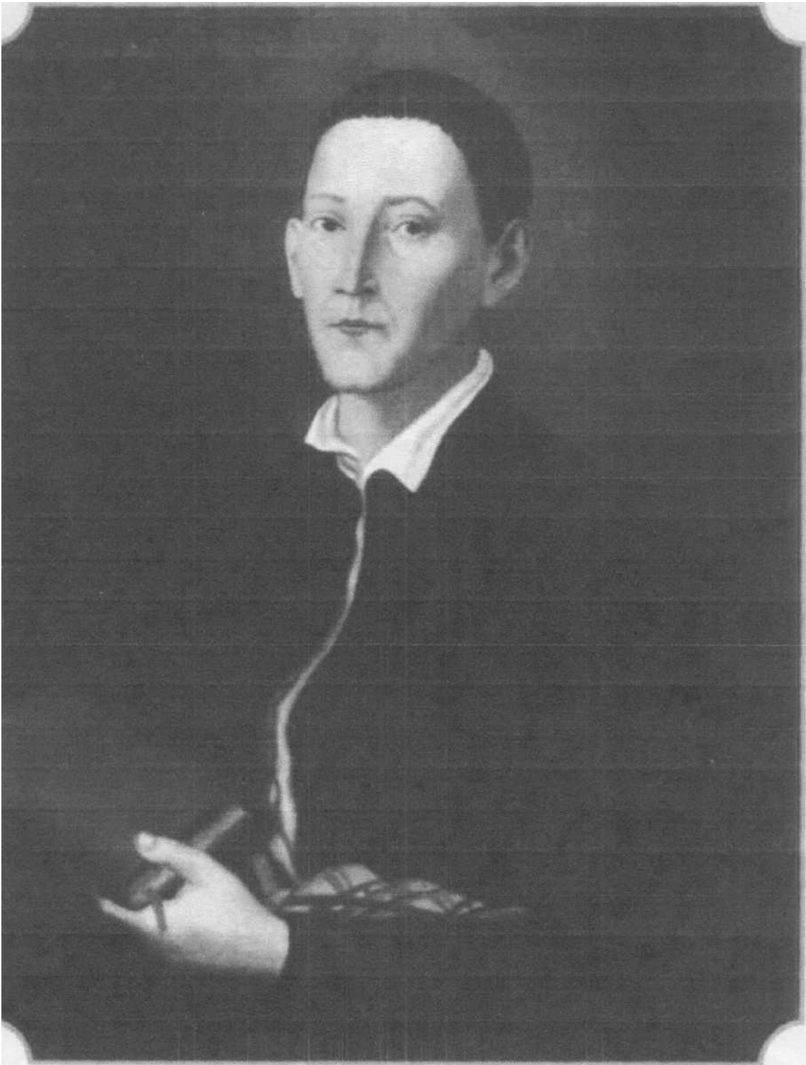
Портрет Григорія Сковороди.