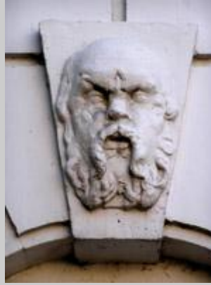
Картуш Сократ на Будинку Учителя. (Педагогічний музей) вул. Володимирська, 57

Сократ (470-399 до р. х.) давньогрецький філософ. Своїх творів філософ Сократ не залишив, тому про його погляди ми можемо судити тільки на підставі творів інших грецьких філософів (головним чином у книгах його учня Платона ). Сократ намагався твердо обґрунтувати етичні поняття - справедливості, чесності, совісті, щастя. Афіньським судом, за невір'я у вітчизняних богів і введення нових божеств, Сократ був присуджений до страти і добровільно прийняв отруту(кажуть-цикуту)