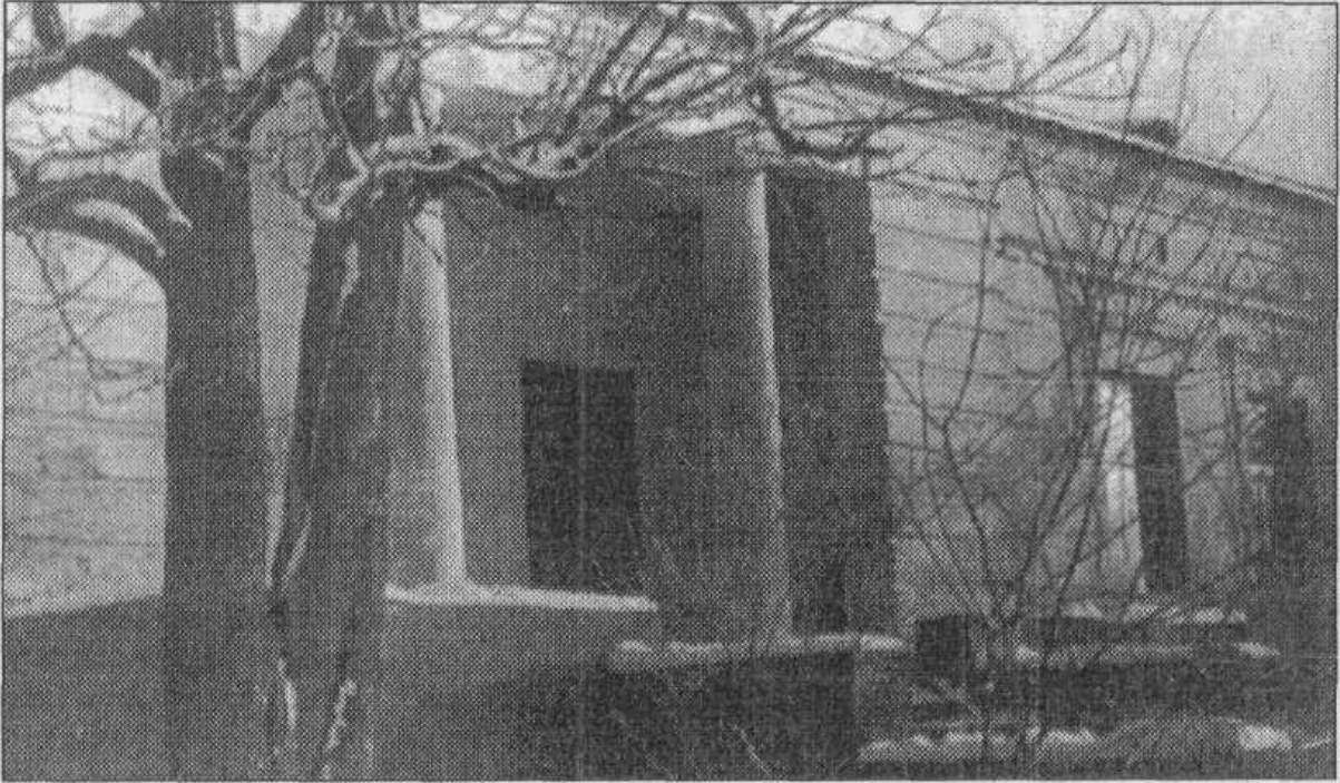
Будинок в Іванівці – останній притулок Сковороди